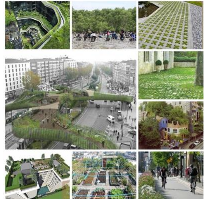
ตัวชี้วัดบูรณาการของสำนักสิ่งแวดล้อมและสำนักงานเขต